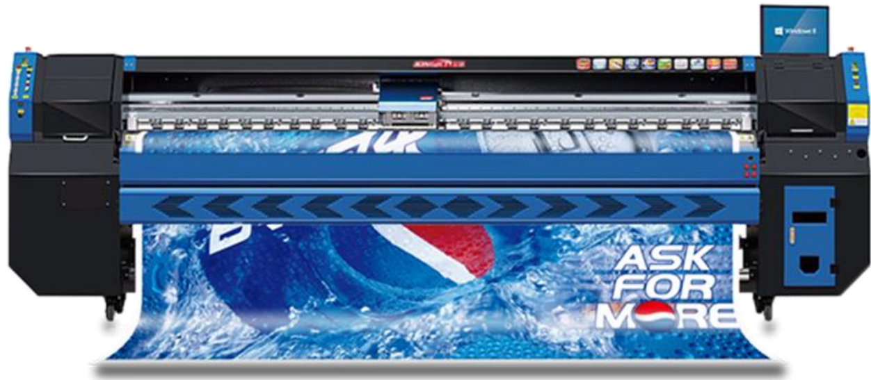
Tặng Thay Bạt