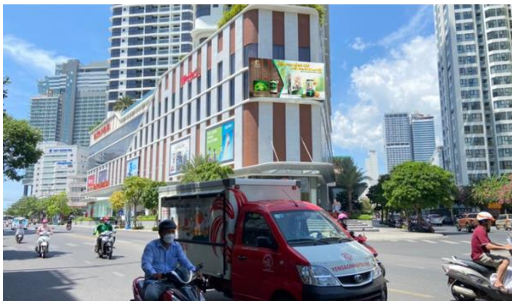
Tặng Thời Gian Quảng Cáo