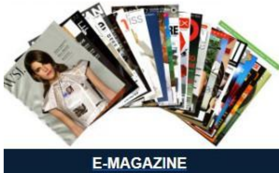
Tặng Bộ Marketing stratege